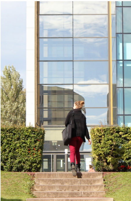
université de Caen Normandie