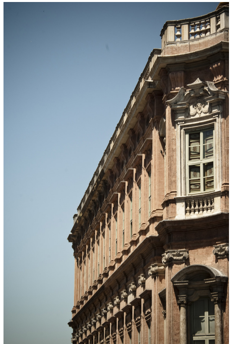
université pour étrangers de Pérouse