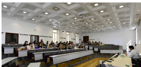
université de Caen Normandie