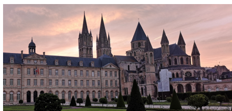
mairie de la ville de Caen, Normandie

Non, pendant toute la durée du programme les étudiant(e)s sélectionnés devront être régulièrement inscrits auprès de l'université d'origine, voilà pourquoi ils seront exonérés du paiement des frais d'inscription dans l'université d'accueil (à l'exception des coûts à prévoir pour bénéficier des prestations complémentaires telles que le logement, les repas, les activités sportives etc.). Les étudiants inscrits au Double Diplôme pourront bénéficier de la bourse Erasmus et seront prioritaires pour obtenir un logement étudiant.